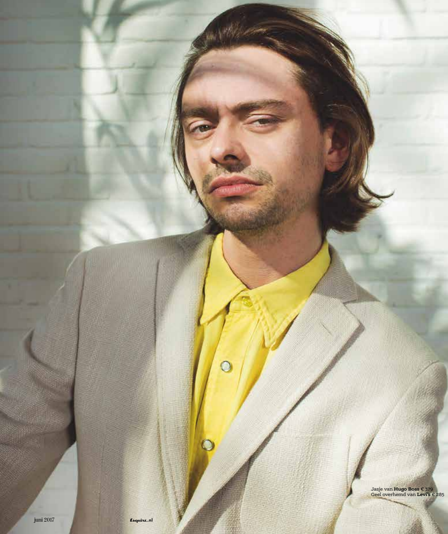
Jasje van Hugo Boss € 379 Geel overhemd van Levi's € 285