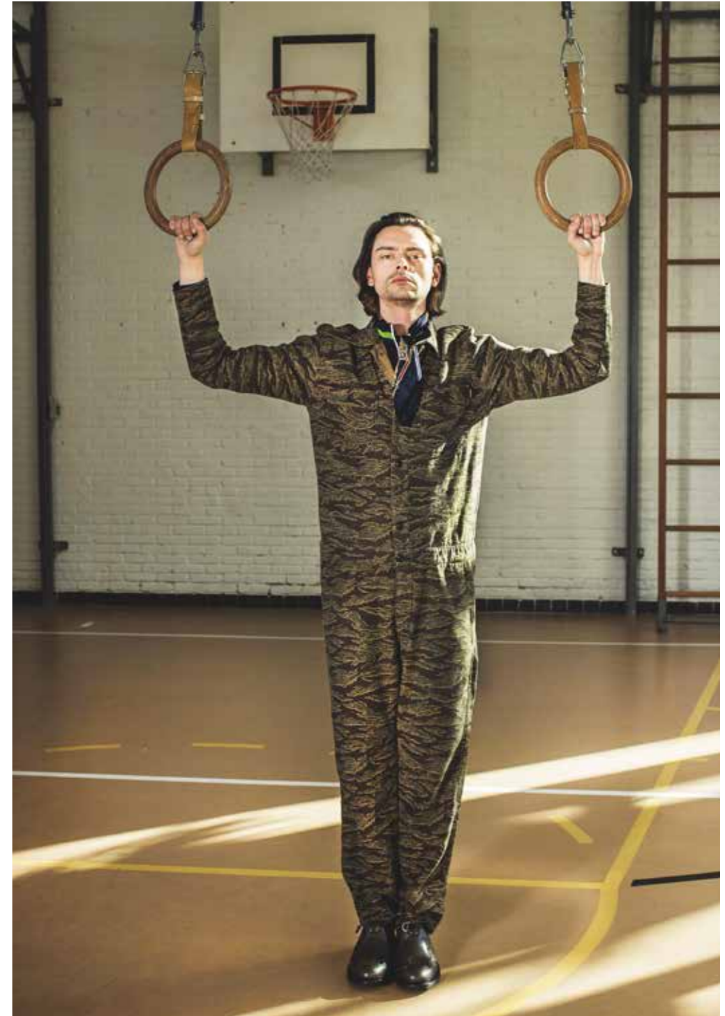
Overall van Carhartt € 160 Schoenen Filippa K € 260 Trainingsjack van Alexander McQueen via de Bijenkorf € 315 Sjaaltje van Hermès prijs op aanvraag